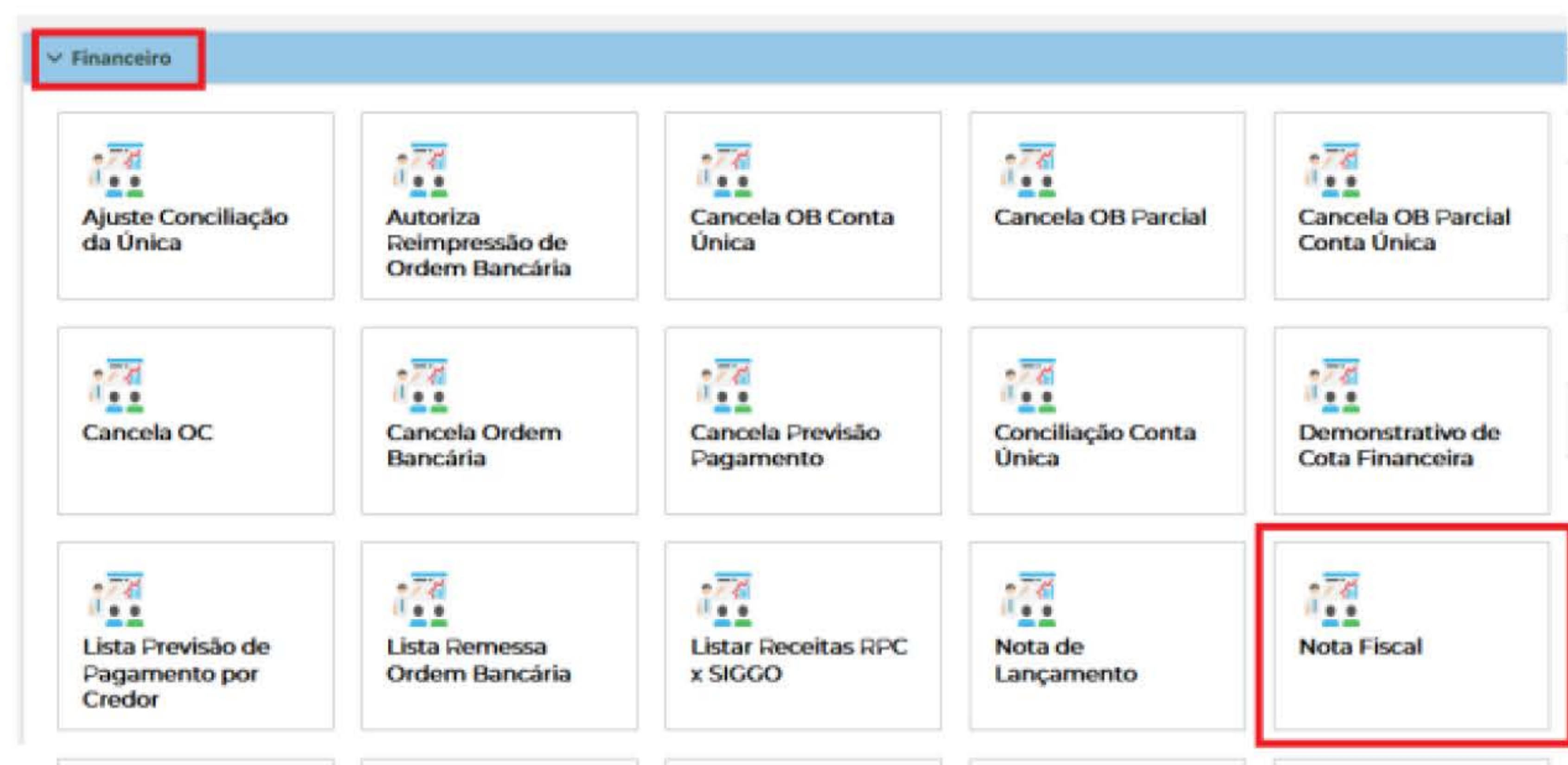
Imagem 10 – Captura do SIGGO Web ilustrando a lista de Nota Fiscal na aba Financeiro.